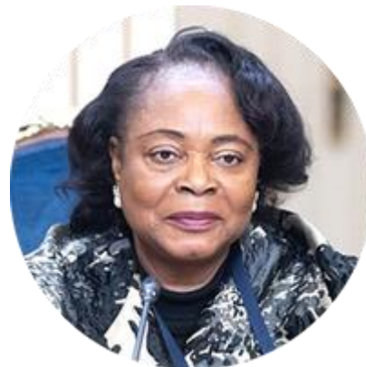
МАРИЯ ТЕРЕСА ЭФУА АСАНГОНО ПРЕДСЕДАТЕЛЬ СЕНАТА ПАРЛАМЕНТА РЕСПУБЛИКИ ЭКВАТОРИАЛЬНАЯ ГВИНЕЯ