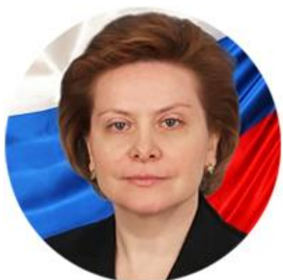
НАТАЛЬЯ КОМАРОВА ГУБЕРНАТОР ХАНТЫ- МАНСИЙСКОГО АВТОНОМНОГО ОКРУГА – ЮГРЫ