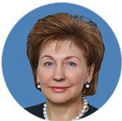
ГАЛИНА КАРЕЛОВА ЗАМЕСТИТЕЛЬ ПРЕДСЕДАТЕЛЯ СОВЕТА ФЕДЕРАЦИИ ФЕДЕРАЛЬНОГО СОБРАНИЯ РОССИЙСКОЙ ФЕДЕРАЦИИ