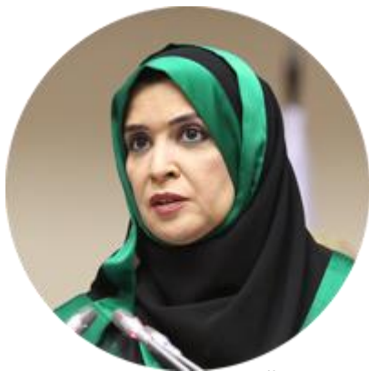
АМАЛЬ АЛЬ-КУБЕЙСИ ПРЕДСЕДАТЕЛЬ ФЕДЕРАЛЬНОГО НАЦИОНАЛЬНОГО СОВЕТА ОАЭ