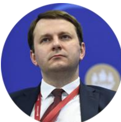
МАКСИМ ОРЕШКИН МИНИСТР ЭКОНОМИЧЕСКОГО РАЗВИТИЯ РОССИЙСКОЙ ФЕДЕРАЦИИ