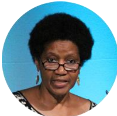
ФУМЗИЛЕ МЛАМБО-НГУКУА ИСПОЛНИТЕЛЬНЫЙ ДИРЕКТОР СТРУКТУРЫ «ООН-ЖЕНЩИНЫ», ЗАМЕСТИТЕЛЬ ГЕНЕРАЛЬНОГО СЕКРЕТАРЯ ОРГАНИЗАЦИИ ОБЪЕДИНЕННЫХ НАЦИЙ