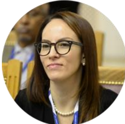
ГАБРИЭЛА КУЭВАС БАРРОН ПРЕЗИДЕНТ МЕЖПАРЛАМЕНТСКОГО СОЮЗА