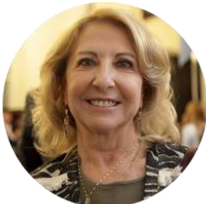
СУСАНА БАЛЬБО ПРЕДСЕДАТЕЛЬ «ЖЕНСКОЙ ДВАДЦАТКИ» (W20) В РАМКАХ ПРЕДСЕДАТЕЛЬСТВА АРГЕНТИНЫ