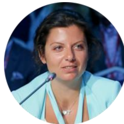
МАРГАРИТА СИМОНЬЯН ГЛАВНЫЙ РЕДАКТОР ТЕЛЕКАНАЛА RT