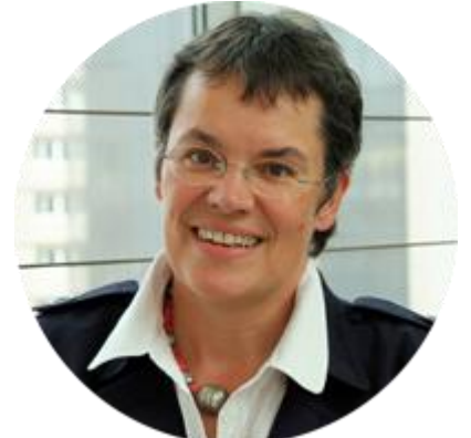
ЛИЛИАН МОРИ ПАСКЪЕ ПРЕДСЕДАТЕЛЬ ПАСЕ