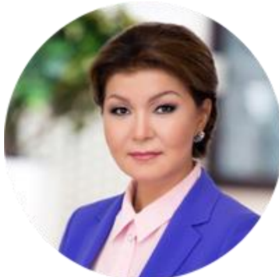
ДАРИГА НАЗАРБАЕВА ПРЕДСЕДАТЕЛЬ КОМИТЕТА СЕНАТА ПАРЛАМЕНТА РЕСПУБЛИКИ КАЗАХСТАН ПО МЕЖДУНАРОДНЫМ ДЕЛАМ, ОБОРОНЕ И БЕЗОПАСНОСТИ