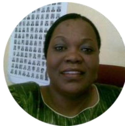
МАМОНАХЕНГ МОКИТИМИ ПРЕДСЕДАТЕЛЬ СЕНАТА КОРОЛЕВСТВА ЛЕСОТО