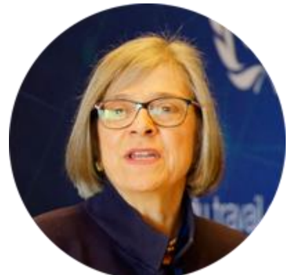
ДЕБОРА ГРИНФИЛД ЗАМЕСТИТЕЛЬ ГЕНЕРАЛЬНОГО ДИРЕКТОРА МОТ