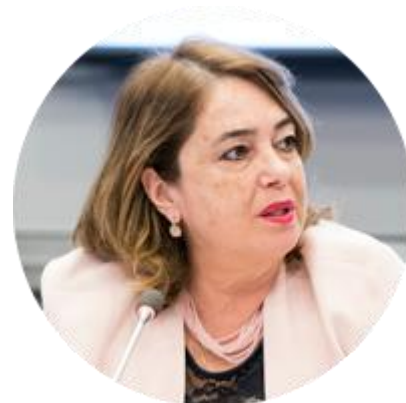
ГЮЛЬДЕН ТЮРКТАН ПРЕЗИДЕНТ-ОСНОВАТЕЛЬ «ЖЕНСКОЙ ДВАДЦАТКИ» (W20)