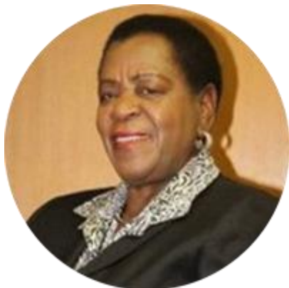
ЭДНА МАДЗОНГВЕ ПРЕДСЕДАТЕЛЬ СЕНАТА ЗИМБАБВЕ