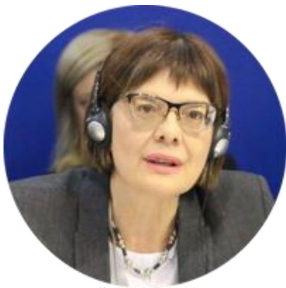
МАЙЯ ГОЙКОВИЧ ПРЕДСЕДАТЕЛЬ НАРОДНОЙ СКУПЩИНЫ РЕСПУБЛИКИ СЕРБИИ