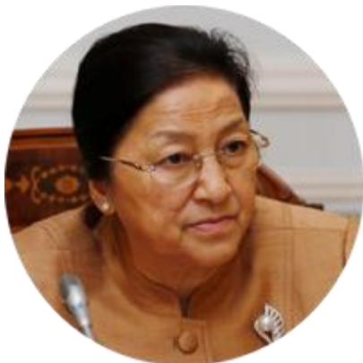
ПАНИ ЯТХОТУ ПРЕДСЕДАТЕЛЬ НАЦИОНАЛЬНОГО СОБРАНИЯ ЛАОССКОЙ НАРОДНО- ДЕМОКРАТИЧЕСКОЙ РЕСПУБЛИКИ