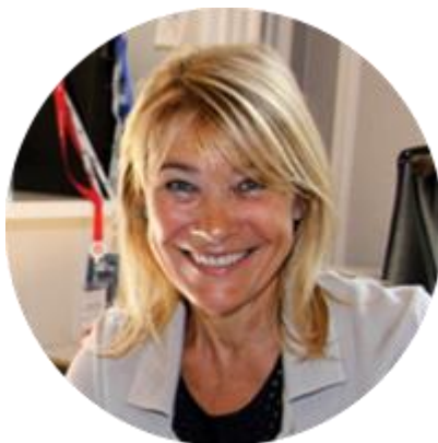
НАДЕЖДА РЕМИ-СИЛАНОВА ФРАНЦУЗСКИЙ ПОЛИТИК, КАНДИДАТ НА ВЫБОРАХ В ЕВРОПАРЛАМЕНТ В 2019 Г.