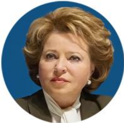
ВАЛЕНТИНА МАТВИЕНКО ПРЕДСЕДАТЕЛЬ СОВЕТА ФЕДЕРАЦИИ ФЕДЕРАЛЬНОГО СОБРАНИЯ РОССИЙСКОЙ ФЕДЕРАЦИИ