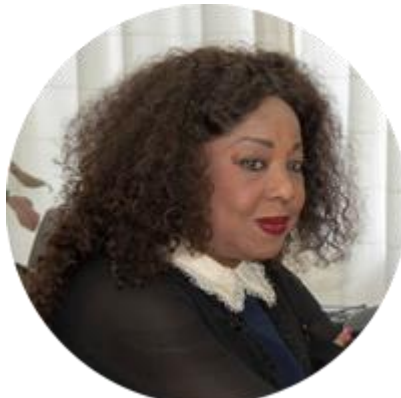
ФАТМА САМОУРА ГЕНЕРАЛЬНЫЙ СЕКРЕТАРЬ МЕЖДУНАРОДНОЙ ФЕДЕРАЦИИ ФУТБОЛА (ФИФА)