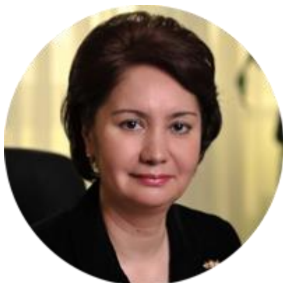
ГУЛЬШАРА АБДЫКАЛИКОВА ГОСУДАРСТВЕННЫЙ СЕКРЕТАРЬ РЕСПУБЛИКИ КАЗАХСТАН