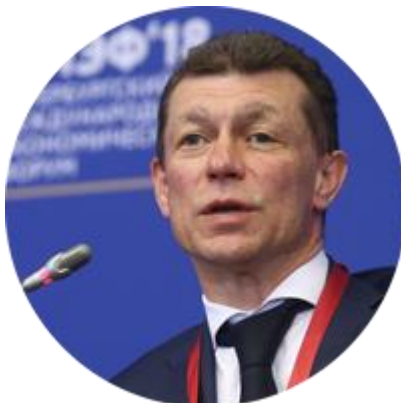
МАКСИМ ТОПИЛИН МИНИСТР ТРУДА И СОЦИАЛЬНОЙ ЗАЩИТЫ РОССИЙСКОЙ ФЕДЕРАЦИИ