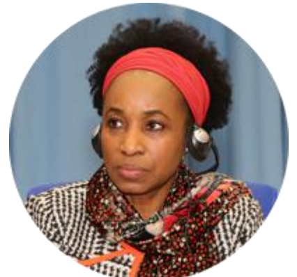
ФАТУ ХАЙДАРА УПРАВЛЯЮЩИЙ ДИРЕКТОР ЮНИДО ПО ВОПРОСАМ КОРПОРАТИВНОГО УПРАВЛЕНИЯ И ОПЕРАТИВНОЙ ДЕЯТЕЛЬНОСТИ