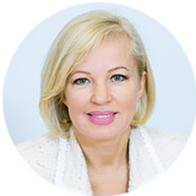
ИРИНА МАКИЕВА ЗАМЕСТИТЕЛЬ ПРЕДСЕДАТЕЛЯ ГОСУДАРСТВЕННОЙ КОРПОРАЦИИ «БАНК РАЗВИТИЯ И ВНЕШНЕЭКОНОМИЧЕСКОЙ ДЕЯТЕЛЬНОСТИ» (ВНЕШЭКОНОМБАНК)