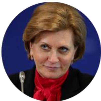
АННА ПОПОВА РУКОВОДИТЕЛЬ ФЕДЕРАЛЬНОЙ СЛУЖБЫ ПО НАДЗОРУ В СФЕРЕ ЗАЩИТЫ ПРАВ ПОТРЕБИТЕЛЕЙ И БЛАГОПОЛУЧИЯ ЧЕЛОВЕКА