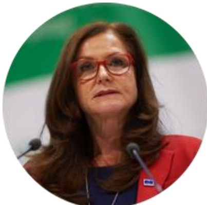
ГУДРУН МОСЛЕР-ТЁРНСТРЁМ ПРЕДСЕДАТЕЛЬ КОНГРЕССА МЕСТНЫХ И РЕГИОНАЛЬНЫХ ВЛАСТЕЙ СОВЕТА ЕВРОПЫ