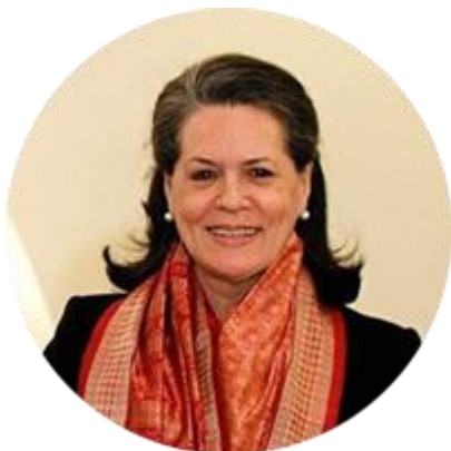
СОНЯ ГАНДИ ЛИДЕР ОБЪЕДИНЕННОГО ПРОГРЕССИВНОГО АЛЬЯНСА