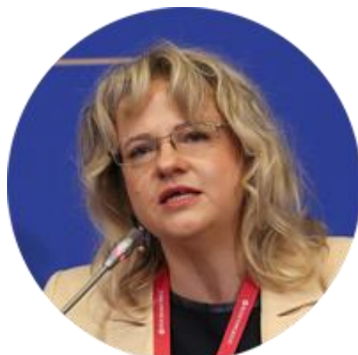
СВЕТЛАНА ЛУКАШ РОССИЙСКИЙ ШЕРПА В «ГРУППЕ ДВАДЦАТИ», ЗАМЕСТИТЕЛЬ НАЧАЛЬНИКА ЭКСПЕРТНОГО УПРАВЛЕНИЯ ПРЕЗИДЕНТА РОССИЙСКОЙ ФЕДЕРАЦИИ